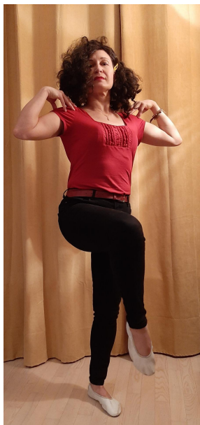
Mama dumnie kroczy