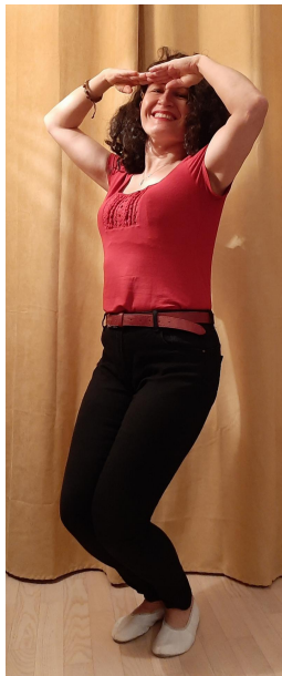
Mama wypatruje jastrzębia