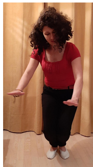
Dumna mama kwoka uratowała kurczęta, liczy je i idą spać.

Poznaliśmy też znakomitą piosenkę „Kokoszka” ( https://youtu.be/iFIKPF0gRY ) Zilustrujcie ją ruchem , zgodnie z tekstem. Pamiętajcie o mocniejszym śpiewie niektórych wersów, pokazywaniu szponów, darcia piórek itd. Ogólnie dykcja i wyraz twarzy.