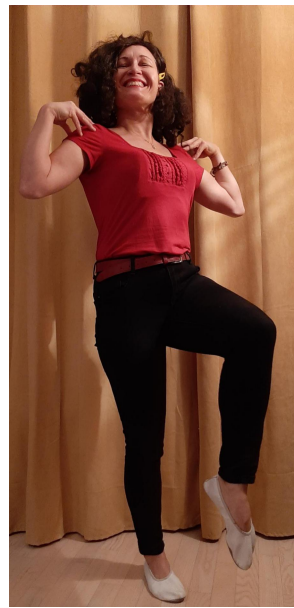
Mama powraca zadowolona do gniazda