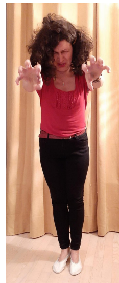
Jastrząb nadstawia szpony